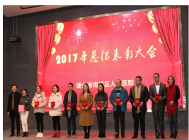
表彰工会积极分子